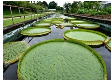
パラグアイオニバス（スイレン科）