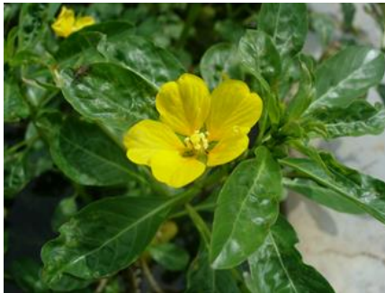
ミズキンバイ（アカバナ科）