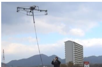
バッテリーを気にしないマルチコプター (大阪市立大学)

す。オープンイノベーションを活用した新たな事業や、大学・研究機関等とのコラボレーションによる製品開発などを検討されている方は、ぜひお越しください。