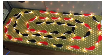
ゆらぎ発振器 (兵庫県立大学)